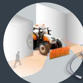
Querkamerasystem QKMS als Option