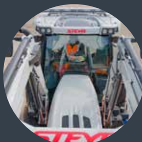
Frontladerlösungen ab Werk