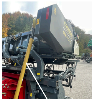
GELENKWELLE BLEIBT ANGESCHLOSSEN BEI KLAPPVORGANG & STRASSENFAHRT KEIN ABSTIEGEN NOTWENDIG

Spezialschumacher Ährenheber mit Höhen- & Neigungsverstellung für alle Fingersysteme