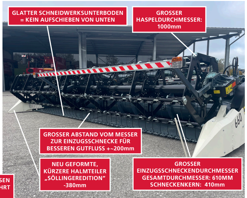
GLATTER SCHNEIDWERKSUNTERBODEN = KEIN AUFSCIEBEN VON UNTEN